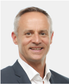
DR. TILL HORNUNG CEO KLINIKEN VALENS

Die medizinische, therapeutische und pflegerische Behandlung basiert auf einem gemeinsamen Grundkonzept für die Rehabilitation von Patientinnen und Patienten mit Schädigungen des Nervensystems und des Bewegungsapparates.